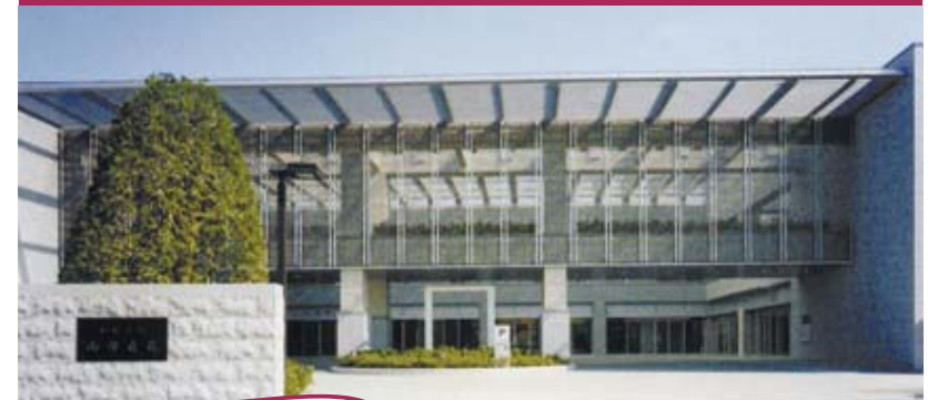
川崎市川崎区夜光3-2-7